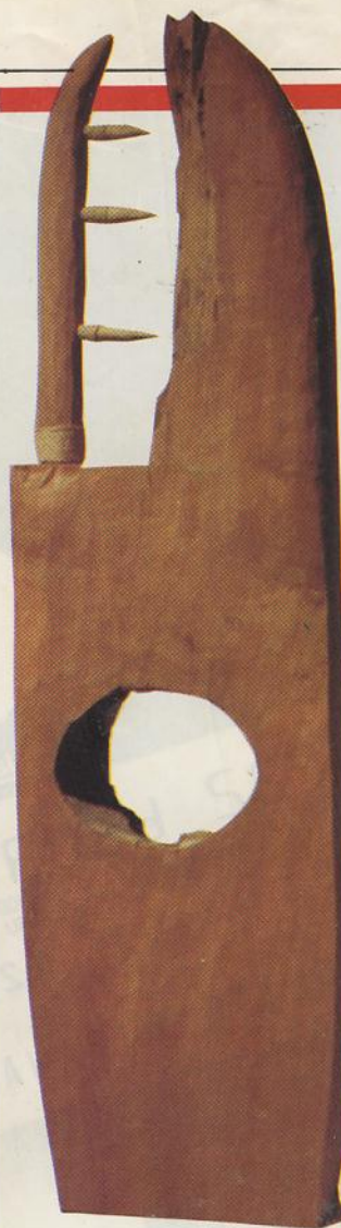
"Ilir-Ilir" Dari keping sampai angin

... mainan bentuk yang tidak logis. Dan bisa ... juga pemirsa yang lain lagi melihatnya se- ... bagai parodi dari bentuk kayu congklak: ... orang di Bosnia hanyalah biji-biji congklak ... yang kalah menangnya berada di tangan ... sang pemain, entah siapa.