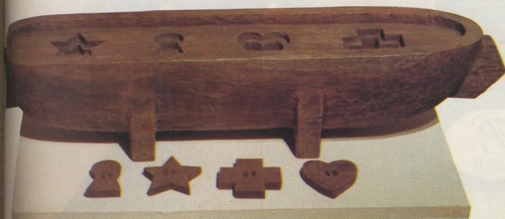
"Tribute to Bosnia Herzegovina" Patung pemain